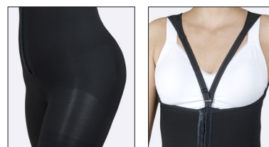
Die Schultergurte können vorne mittig oder seitlich angebracht werden werden.