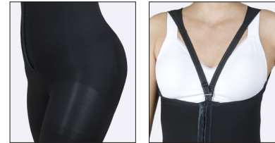
Olkahihnat voidaan kiinnittää etuosan keskelle tai sivuille.