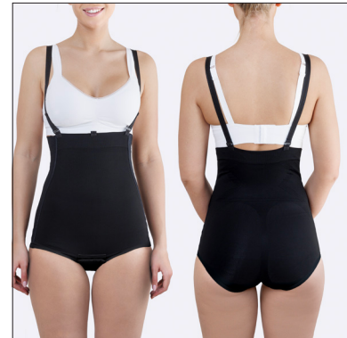
Verschlusshaken an beiden Seiten und im Schritt sowie abnehmbare Schultergurte.