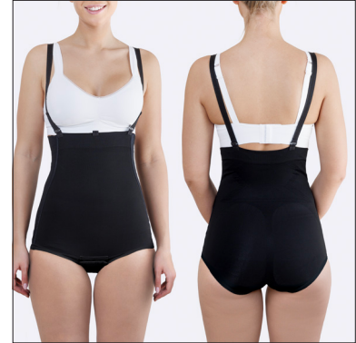
Hakaskiinnitys kummassakin kyljessä, vyötäröllä silikoninauha ja irrotettavat olkaimet.