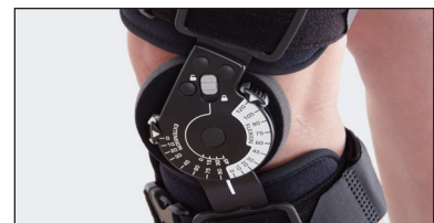
Forlengelse og fleksjon kan justeres og låses fra 0° til 45° i intervaller på 10°/15°. Kontrollert bevegelsesområde mellom 0° og 120° bestemmes enkelt med en trykknapp i intervaller på 10°/15°.