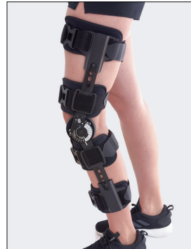
Med den teleskopiske mekanismen kan ortosens lengde justeres, fra 48 cm til 63,5 cm.