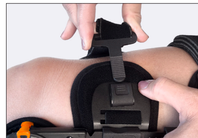
Riemen mit Schnellverschluss.