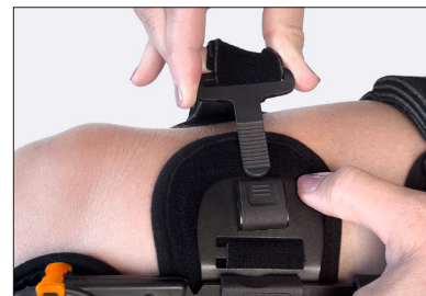
Hurtigudløsende spænde på remmene.