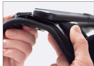
Aluminiumsmansjettene kan formes slik at de passer til beinet.