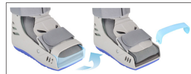
Avtagbart och justerbart tåskydd.