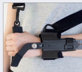
Håndtag til neutral position kan bestilles separat.

Leddets justerbar helarmsortose, der bruges til postoperativ eller posttraumatisk arm- og albue-stabilisering. Det giver kontrolleret bevægelsesområde eller immobilisering med stop i bøjningsretningen fra 0° til 120° og i forlængelsesretningen fra 0° til 90°. Længden justeres med en teleskopmekanisme. Den polstrede skulderrem kan give ekstra aflastning. Ortoesen er behagelig at have på og sidder sikkert mod armen. Den fås til højre og venstre arm i en universel størrelse. Art.nr.20205.