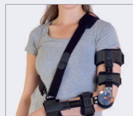
Polstret skulderrem til aflastning medfølger.