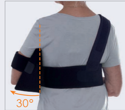
Komfortabel og stabil i ryggen.

✓ Lindring og smertelindring ved proksimale humerusfrakturer