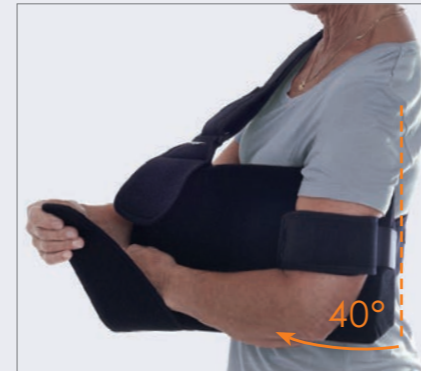
Let at åbne for til eksempel træning.

"Giver en sikker følelse under hele dagen og natten"