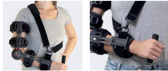
Medfølgende skulderrem kan give ekstra aflastning.

✓ Formbare manchetter for en perfekt pasform