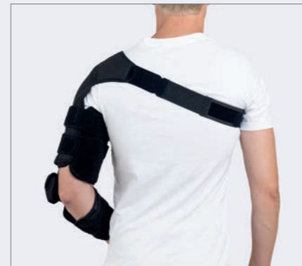
Justerbar flexion/extension i albueledet.