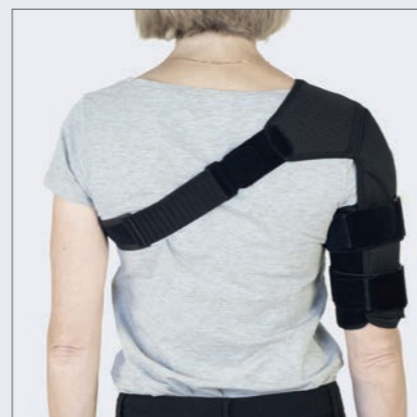
Passer til både højre og venstre arm.