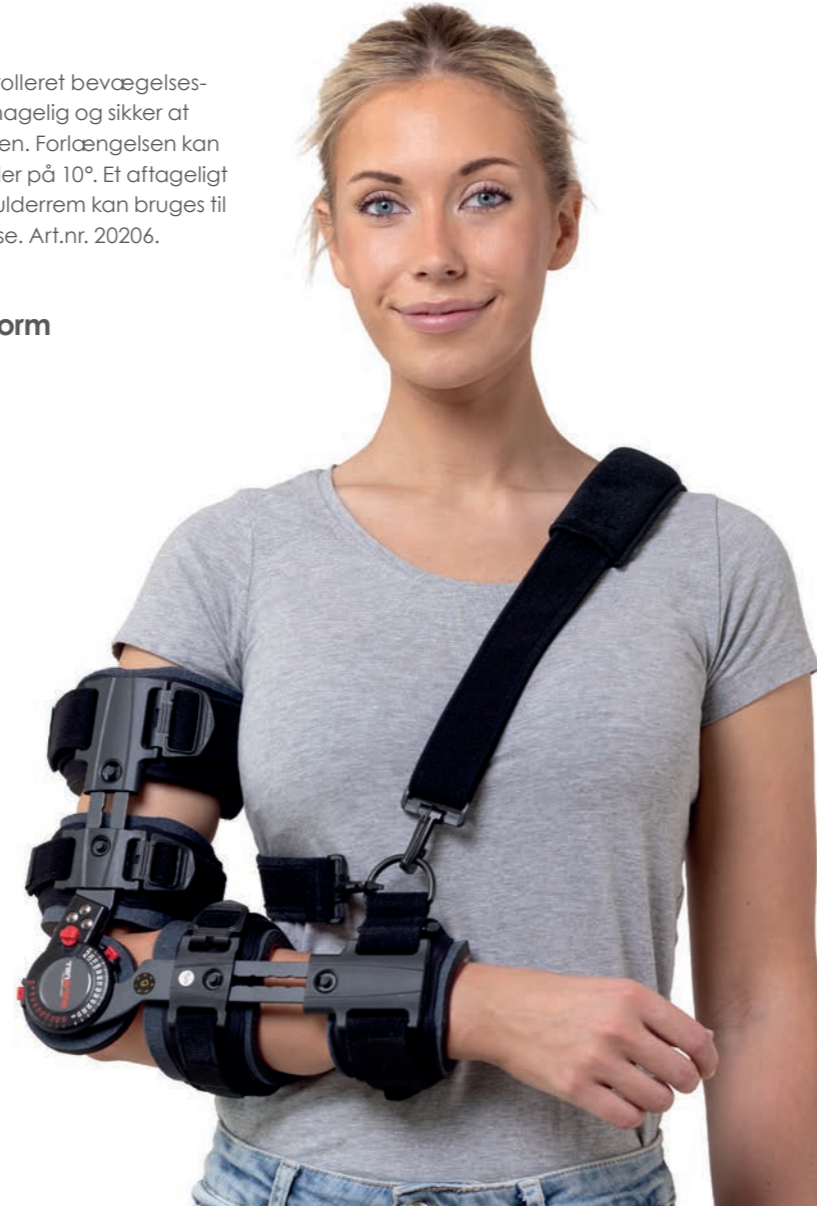
Stabil aftagelig hånddel til fiksering og begrænsning af rotation.