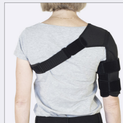
Passer både høyre og venstre arm.