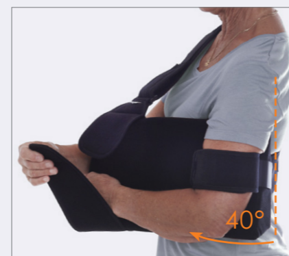
Lett å åpne for eksempel trening.

"Gir en trygg og følelse under hele dagen og natten"