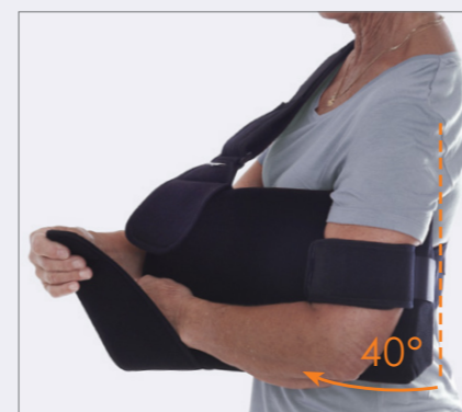
Enkel att öppna vid tex träning.

"Ger en trygg och säker känsla under hela dygnet"