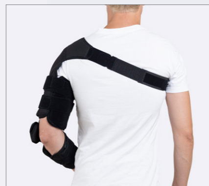
Ställbar flexion/extension i armbågsleden.