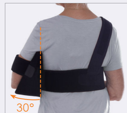
Bekväm och stabil i ryggen.

✓ Avlastning och smärtlindring vid proximala humerusfrakturer