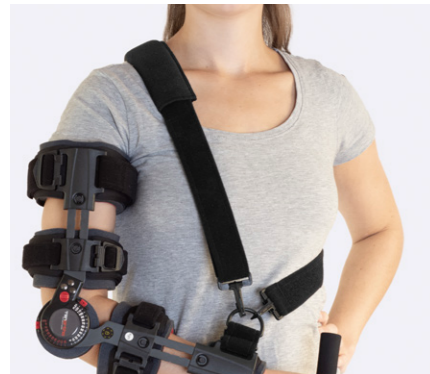
Axelremmen som medföljer kan ge extra avlastning.