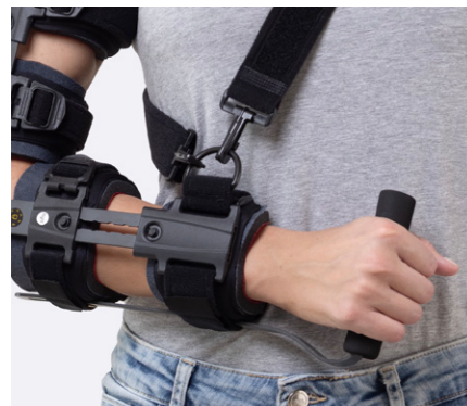
Stabil avtagbar handdel för fixering och begränsning av rotation.