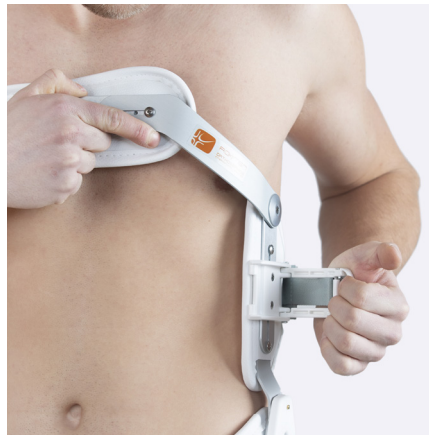
Gennemprøvet ortose tages let af og på med et fjederbelastet spænde.