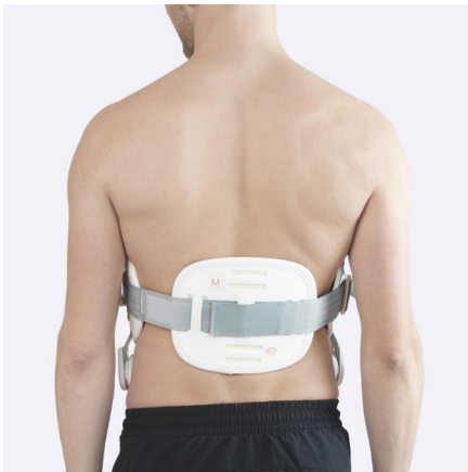
Bagerste plade kan placeres vandret eller lodret.