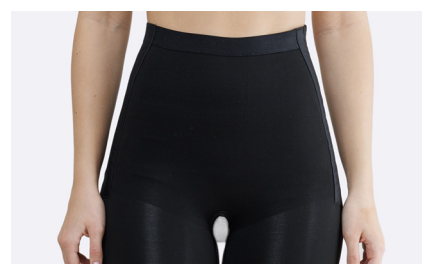
Stickningen är förstärkt över buken.