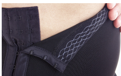
Silikon håller byxan på plats och knäpningen i 3 steg underlättar applicering.