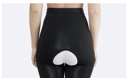
Med den öppna grenen kan byxorna sitta på vid toalettbesök.