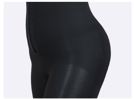
Strikket til at følge kroppens kontur.