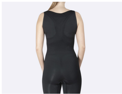
Bredt snitt i ryggen og fleksibel passform.