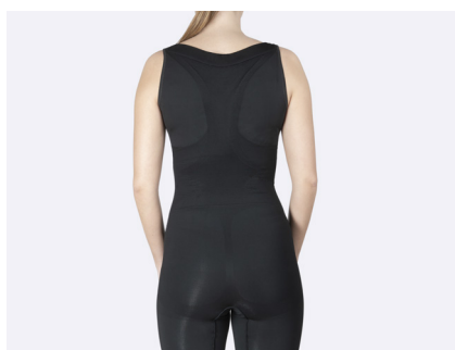
Brett skuren i ryggen och följsam passform.