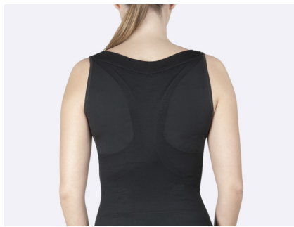
Brett skuren i ryggen och följsam passform.