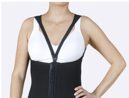
De justerbara axelbanden kan fästas mitt fram eller i sidorna.