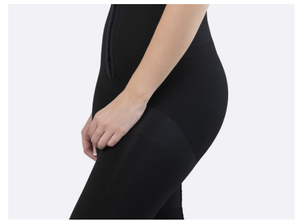
Formstickad för att följa kroppens kontur.