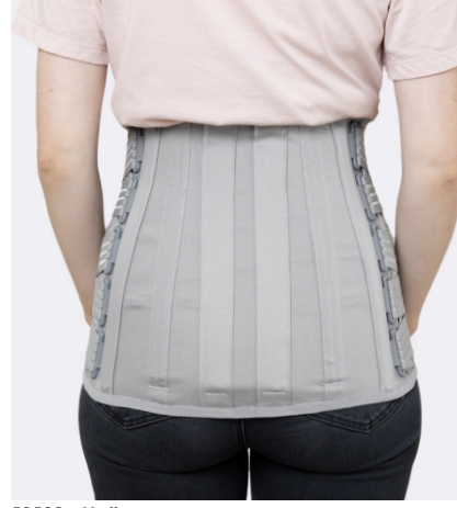
50532 - Mellan