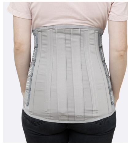
50533 - Hög