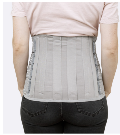
50531 - Låg