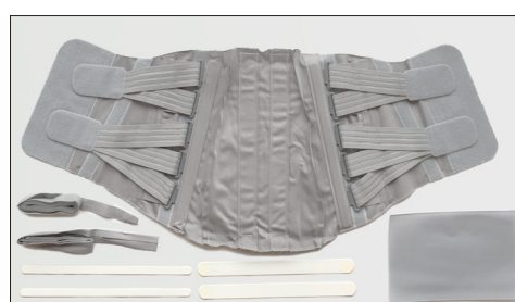
Ronja Kit - 50536