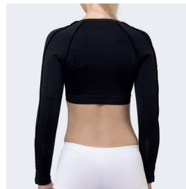
Passt sich dem Körper an.