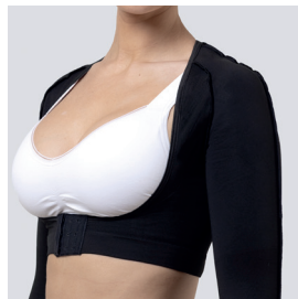
Sanfte Seitenstütze für eine reizfreie Passform.