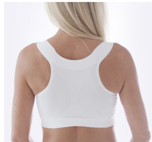
Brottarrygg och breda sidor. Mjuk bred sömlös kant under bysten mot eventuella snitt.