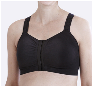
Breda och reglerbara axelband som justeras framtill. Mirabelle finns i vit och svart.