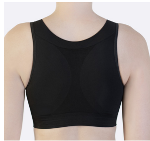
Bred i ryggen og høj i sider. Blød, sømløs kant under barmen mod eventuelle snit.