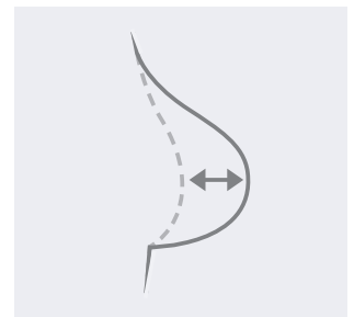
Ekstra elastiske, trykkfrie kopper.