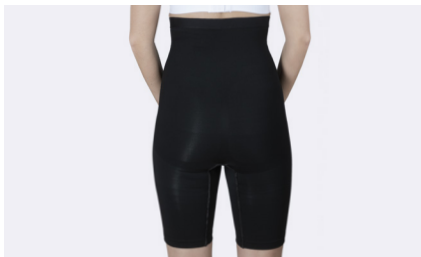
Behagelig pasform med brugerdefineret kompression.