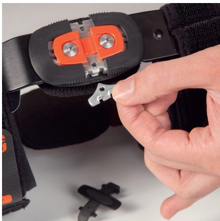
Flad polycentrisk led med plug-in-stops for at begrænse fleksion og ekstension.