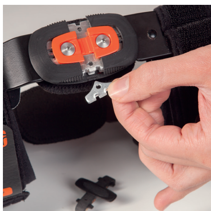
Flatt polysentrisk ledd med plug-in stoppere for å begrense fleksjon og ekstensjon.