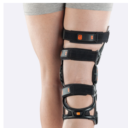
Stroppene er nummererte, justerbare og svært behagelige mot huden.