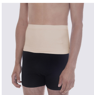
Skjuler stomi bandagen