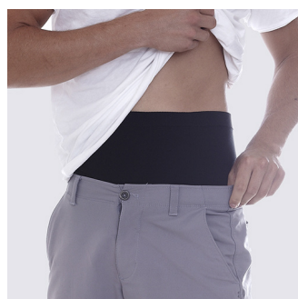
Ei näy vaatteiden alta