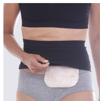
Istuu mukavasti alusvaatteiden alla ja päällä