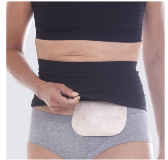
Sitter bekvämt både under och över underkläder