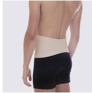
Smalare form i ryggen