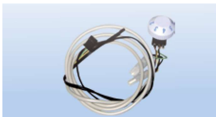
Potentiometer för att aktivera Isotherm Smart Energy Control-läget.