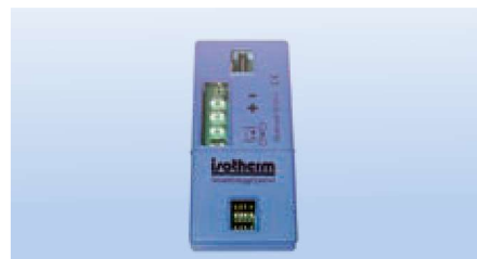
Processorbaserad modul som ska anslutas till Danfoss/Secop-kompressorn.

Smart Energy Control gör inte bara kylskåpet intelligent, utan låter även en stor mängd kyla lagras i mat och dryck. Isotherm Smart Energy Control minskar skåpets temperatur mer än ett traditionellt kylskåp utan att frysa maten. Detta övervakas kontinuerligt av en temperatursensor i skåpet. Kylenergin lagras när ett strömöverskott är tillgängligt (motor på, solpanel eller anslutning till landström) och återanvändas först innan kylskåpet åter körs på batteriet.