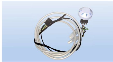
Potentiometer för att aktivera Isotherm Smart Energy Control-läget.