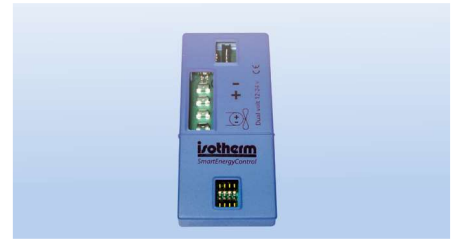
Processorbaserad modul som ska anslutas till Danfoss/Secop-kompressorn.

Smart Energy Control gör inte bara kylskåpet intelligent, utan låter även en stor mängd kyla lagras i mat och dryck. Isotherm Smart Energy Control minskar skåpets temperatur mer än ett traditionellt kylskåp utan att frysa maten. Detta övervakas kontinuerligt av en temperatursensor i skåpet. Kylenergin lagras när ett strömöverskott är tillgängligt (motor på, solpanel eller anslutning till landström) och återanvändas först innan kylskåpet åter körs på batteriet.