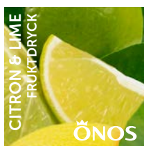
Citron & Lime