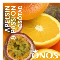
Äpelsin & Passion