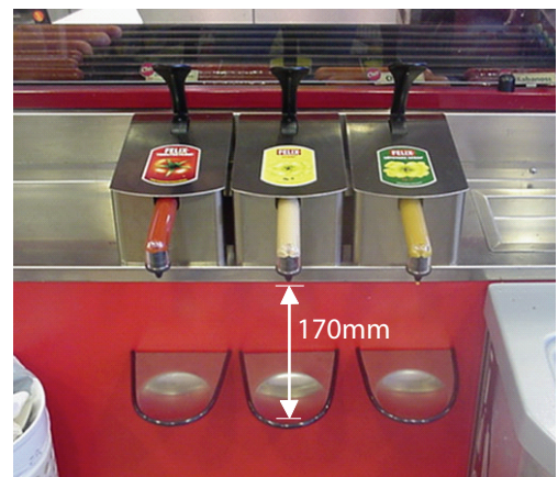
Korrekt monterad Sentomat®