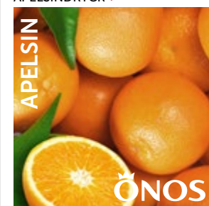
65321 Apelsindryck, konc 10 liter BiB Menigo: 710284 Martin & Servera: 431171 Svensk Cater: 65321 Mårdskog & Lindqvist: 65321

För beställning och service av utrustning, kontakta servicecenter 020-12 10 80, utrustning.orklafoods.se Dryck beställs via grossist.