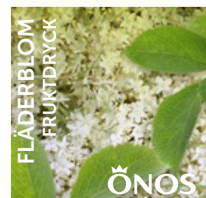
57621 Fläderblom 10 liter BiB Menigo: 109777 Martin & Servera: 443705 Svensk Cater: 57621 Mårdskog & Lindqvist: 57621