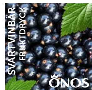
54721 Svartvinbär 10 liter BiB Menigo: 102986 Martin & Servera: 170977 Svensk Cater: 54721 Mårdskog & Lindqvist: 54721