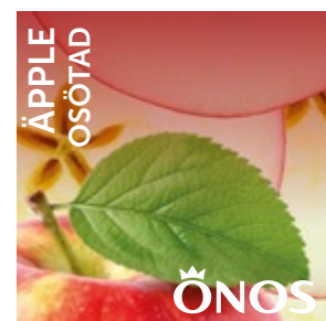
16321 Äpple 10 liter BiB Menigo: 735775 Martin & Servera: 585604 Svensk Cater: 16321 Mårdskog & Lindqvist: 16321