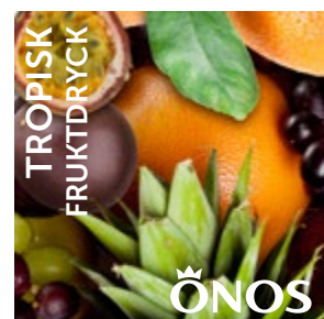
57521 Tropisk 10 liter BiB Menigo: 115101 Martin & Servera: 497222 Svensk Cater: 57521 Mårdskog & Lindqvist: 57521