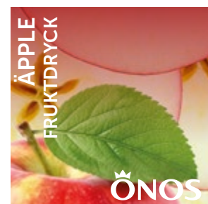
57721 Äpple 10 liter BiB Menigo: 710248 Martin & Servera: 431437 Svensk Cater: 57721 Mårdskog & Lindqvist: 57721