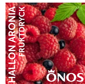
57021 Hallon Aronia 10 liter BiB Menigo: 109776 Martin & Servera: 443689 Svensk Cater: 57021 Mårdskog & Lindqvist: 57021