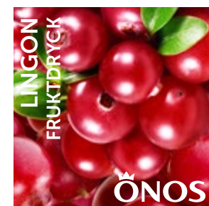
58021 Lingon 10 liter BiB Menigo: 710254 Martin & Servera: 431320 Svensk Cater: 58021 Mårdskog & Lindqvist: 58021