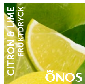
54021 Citron & Lime 10 liter BiB Menigo: 710208 Martin & Servera: 431551 Svensk Cater: 54021 Mårdskog & Lindqvist: 54021