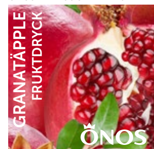
53921 Granatäpple 10 liter BiB Menigo: 103973 Martin & Servera: 205609 Svensk Cater: 53921 Mårdskog & Lindqvist: 53921