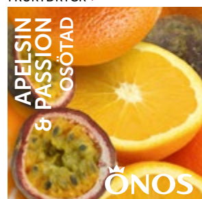
15721 Apelsin & Passion 10 liter BiB Menigo: 735774 Martin & Servera: 585612 Svensk Cater: 15721 Mårdskog & Lindqvist: 15721