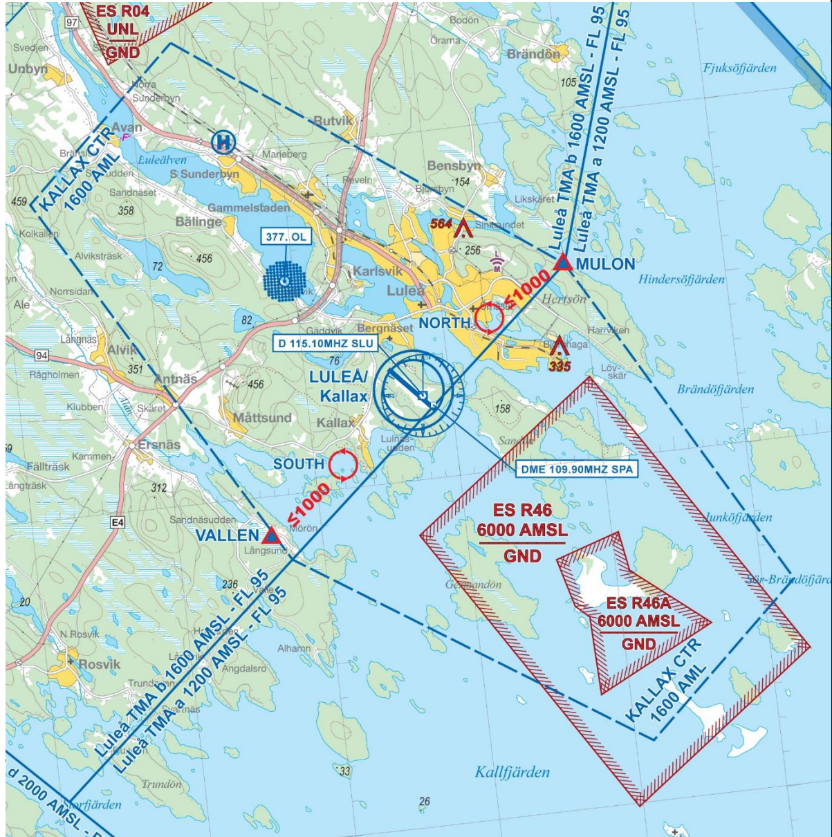
Aktiv från 2022-04-26 (feltrycket) respektive 2022-05-19 (R-området)

Kallax CTR:s ovansida är 1600 AMSL och inget annat. Detta är ett tryckfel som behöver handrättas. Dessutom har ett R-område tillkommit inom CTR vid namn R46A.