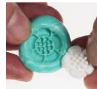
Efter att massan stelnat tar du ur modellen. Alternativt vänta till även silverleran torkat. Den lossnar lättare då.