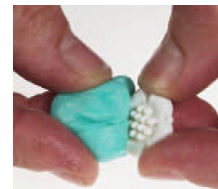
Tryck i din modell i gjutmassan