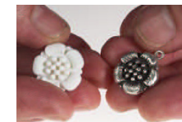
Bränn silverleran och din kopia är klar.