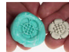
Lyft ur silverleran och låt torka helt.