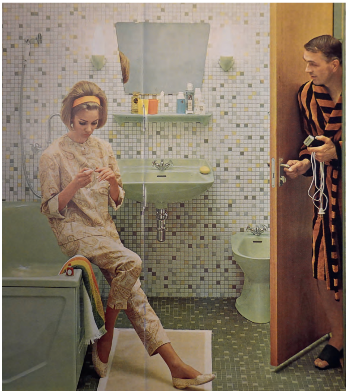
Ur katalog IFO, 1966. Kronprinsen i Malmö

Kakelmosaik är en komposition av små olikfärgade kakelbitar. Metoden har använts i långa tider för att skapa färgskimrande ytor eller göra avbildande mönster.