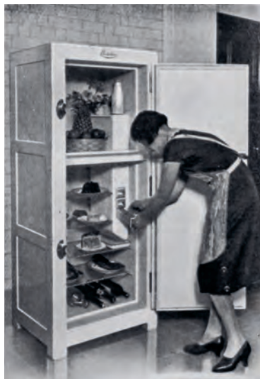
Ur Electrolux Smd födda halva hälsan, 1926