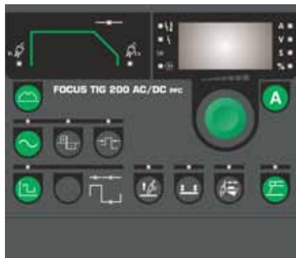
Funktionspanel till Focus TIG 200 AC/DC PFC

svetsning med ca. 25% högre svetsström med endast 16 A nätsäkring