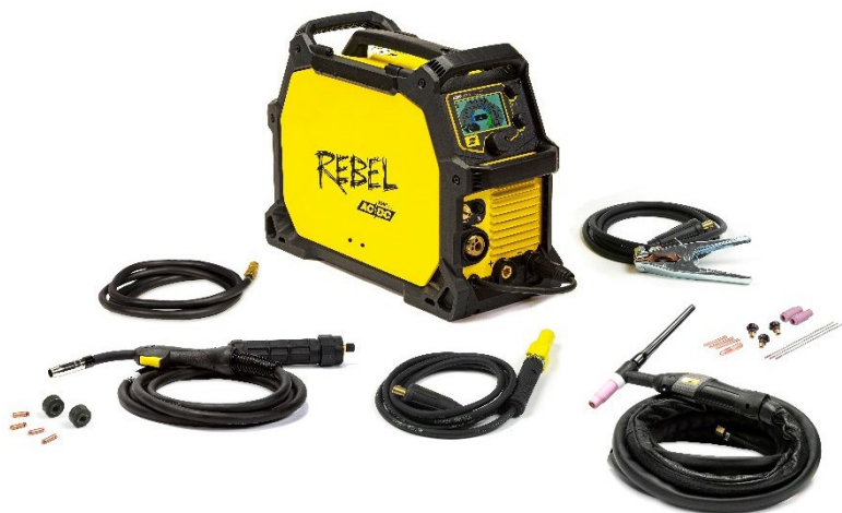
Rebel EMP 205ic AC/DC och tillbehör.