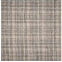
Calderdale Taupe 1080050