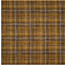
Calderdale Ochre 1080051