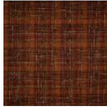
Calderdale Rust 1080052