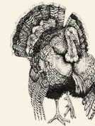
Norfolk svart kalkon