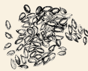
Brittiska kron linfrön