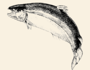
Lax från Skottland