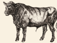
Aberdeen Angus nötkött