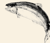
Lax från Skottland