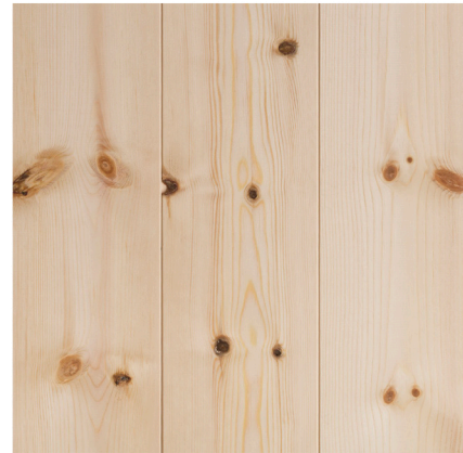
Kvistutslag. Mörka och friska kvistar.

Friska kvistar och mörka kvistar. Större och mer markerande barkdragande kvistar samt kvistutslag förekommer. Bilden visar 14x120 mm, obehandlat.