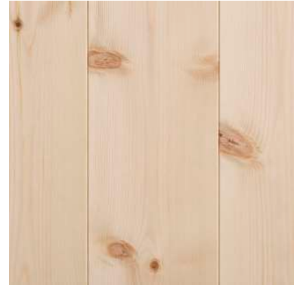
Små kvistutslag i kvist.

Friska kvistar och mindre del mörka kvistar. Obetydliga små kvistutslag och mindre barkdrag runt kvistar förekommer. Bilden visar Slätspont 14x120 mm, obehandlat.