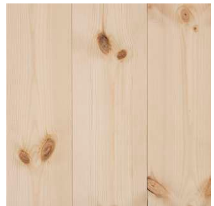
Mörka och friska kvistar.