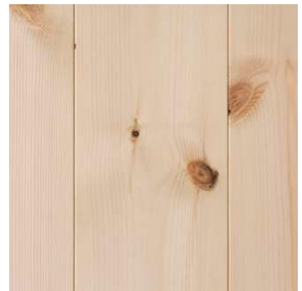
Mörka och friska kvistar.