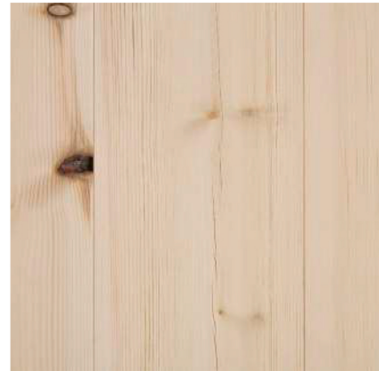
Kvistutslag. Sprickor i yta.

Friska kvistar och mörka kvistar. Markerande och större barkdragande kvistar. Kvistutslag samt mindre sprickor förekommer. Bilden visar 18x170 mm, obehandlat.