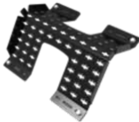
Taksteg för plåttak 3210