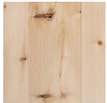
Markerande naturliga ingredienser.