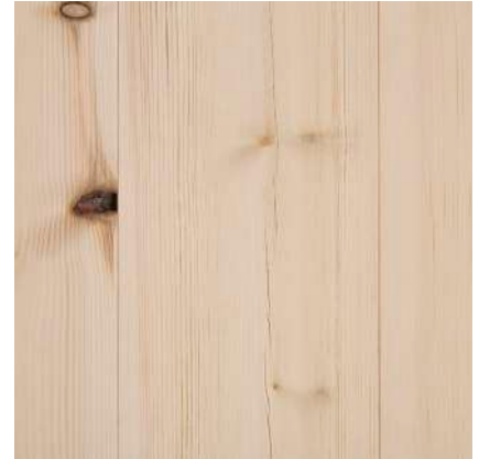
Kvistutslag. Sprickor i yta.