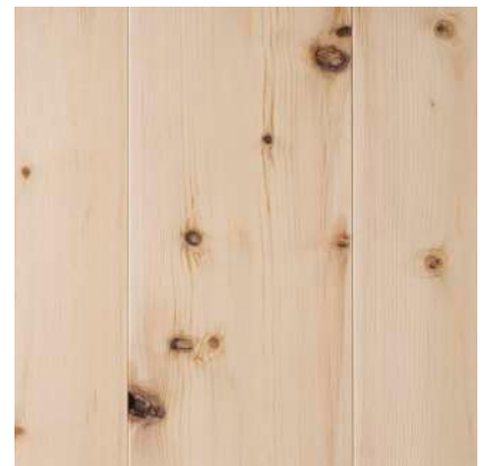
Barkdragande kvist. Kvistutslag.