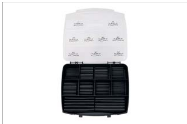
ShrinKit 321 Basic - 220 st 3:1 krypslang i sortimentlåda.