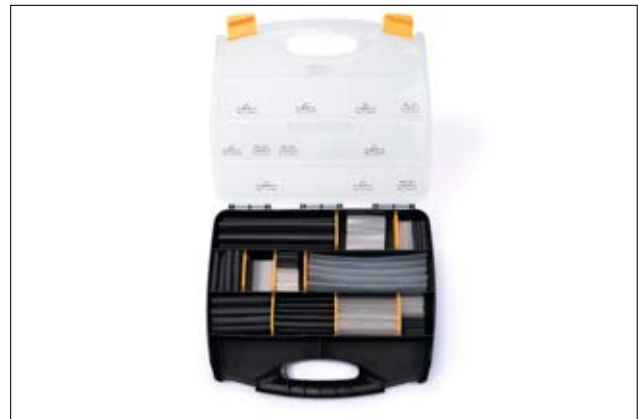
ShrinKit 321-A - 210 st 3:1 limbelagda krypslangar i sortimentlåda.