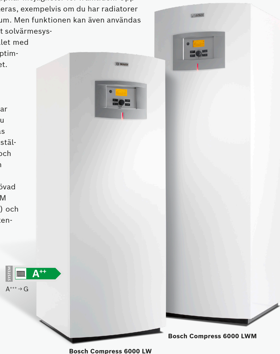
Bosch Compress 6000 LW

Smart elektronik analyserar din varmvattenanvändning och anpassar produktionen efter behovet. Om du spolat upp ett rejält bad prioriteras varmvattenproduktion. Spolat du istället stötväs diskar du förmodligen, och vattenuppvärmningen kan vänta en stund. Compress 6000 LW/M maximerar besparingen med beprövad teknik. Välj mellan modellerna LWM (med inbyggd varmvattenberedare) och LW som du väljer separat varmvattenberedare till efter behov.