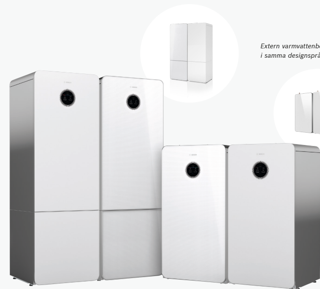
Bosch Compress 7800i LWM

Har du ett väldigt stort behov av varmvatten eller väljer modellen utan inbyggd beredare, så finns externa beredare i precis samma design - med samma rostfria tank.